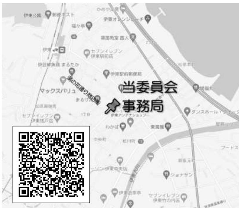
当事務局の地図 (JR 伊東駅から徒歩約4分)