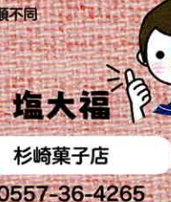
塩大福 杉崎菓子店 ☎0557-36-4265