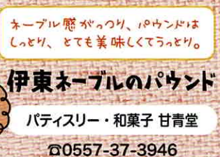
ネーブル感がたっぷり、10センチほど、とても美味しくつとつと。 パティスリー・和菓子 甘青堂 ☎0557-37-3946