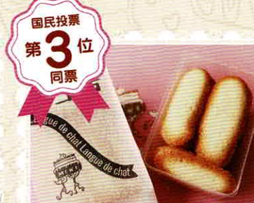
ミニネコの舌 1個 167円