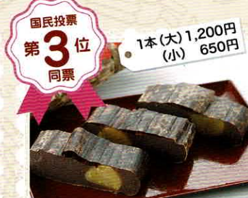
1本(大)1,200円 (小) 650円